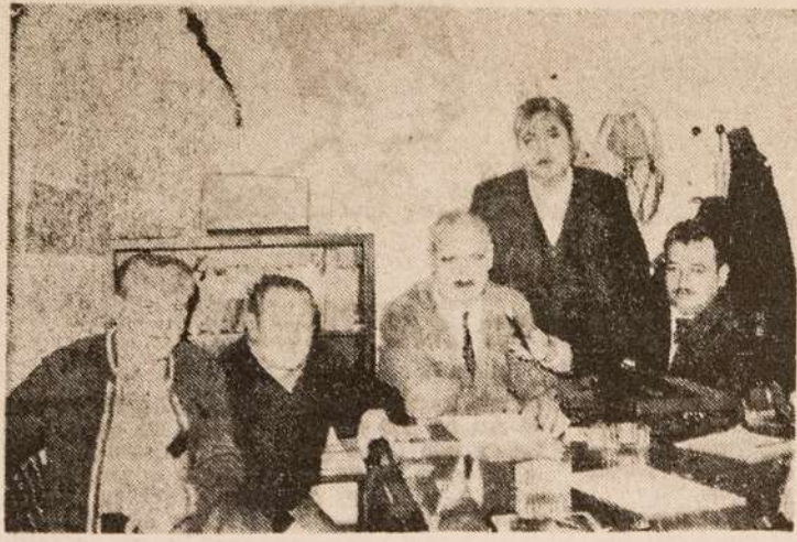
Comisión Directiva de la Asociación Obrera Minera Argentina, Seccional Buenos Aires