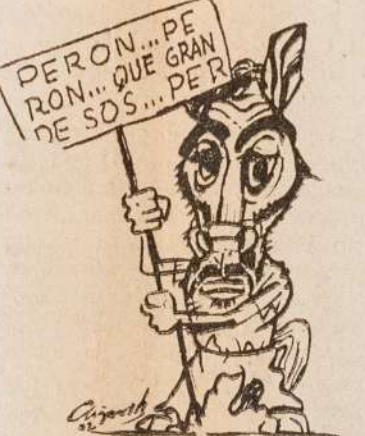
Hubiera convenido cambiar de caballo...

Sobre los anticonceptivos manifestó: "Es indiscutible que están reduciendo el mismo camino de la Taldomina y que los graves daños heréticos que producen los costosos... cuentan con la indiferencia de la Secretaría de Salud Pública y la inconciente complicidad de los que prefieren creer más en