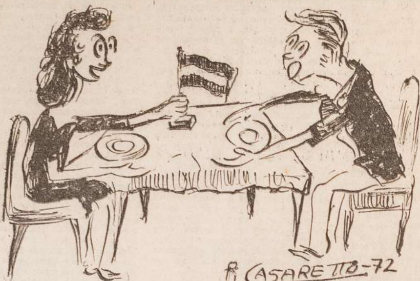
"Comida no hay, pero tengo la banderita del año pasado"

Año XVIII (Quinta Epoca) N° 453 Buenos Aires, 13 de Julio de 1972 Impreso en COPTAL, Rivadavia 767. BA. REGISTRO NAC. DE LA PROP. INT. 1.107.704 CASILLA DE CORREO CENTRAL N° 2.269 Precio del ejemplar $ 1,— ley 18.188 ☆ mSn. 100,—