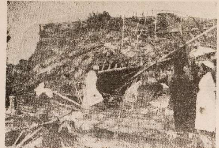
Una prueba del infame bombardeo a ciudades abiertas en Vietnam del Norte. Enfermeras buscando heridos