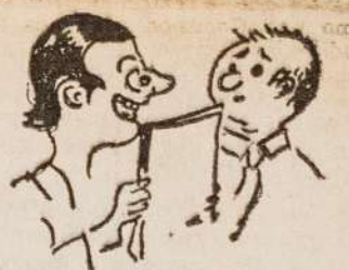
"¿Qué manera de estallar los altos mandos?" "Sin embargo, los que hacen rucha son los mandos bajitos"

Siguiendo este camino de liberación en soberanía, el poder revolucionario ha asegurado que para 1975 toda la tierra del Perú quedará en manos de quienes la trabajan. Está claro pues el sentido profundamente popular-liberador, antimperialista, antifundista y antioligárquico, de las medidas campesinas que en el marco de una real y significativa reforma agraria ha tomado el gobierno de Velasco Alvarado.