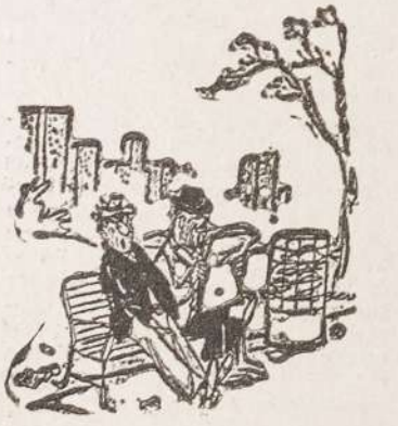
¿Dicen que a los niños les van a dar más vacunas? ¿no sería mejor que les dieran más vacunos?