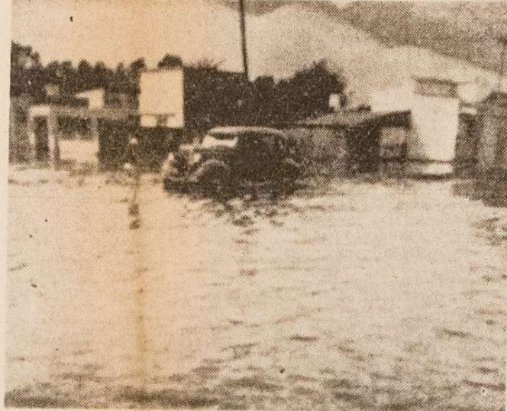
VILLA OBRERA BAJO EL AGUA

Esperamos que urgentemente se tomen las providencias para solucionar ese problema de Villa Obrera. No se espere a que la gente estalle de indignación y haya que acusarla de extremista y mandar la tropa antisubversiva, porque defiende la salud de sus hijos.