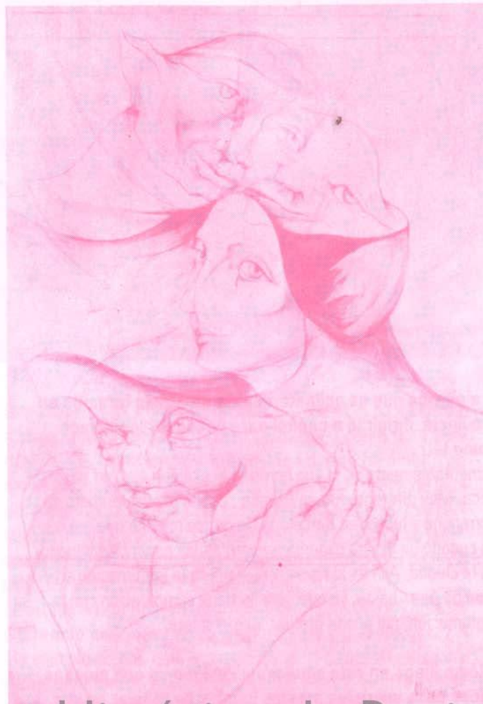
DE LA CONDICIÓN HUMANA / Dibujo 0,0 x 1,00 mts. Oleo. Año 1990

Si comparamos la enseñanza artística en provincia con respecto