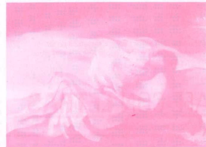
LEDA / Oleo 0,50x0,70 mts. Año 1979

↳ La visión del artista siempre es volar, crecer, desarrollarse. Crear es hacer algo nuevo, y no se puede pensar en la creación artística si no se piensa en innovar. Lógicamente lo nuevo no está dado siempre por la temática sino por la actitud nueva. El arte no tiene nada que ver con el tema, el tema es un pretexto.