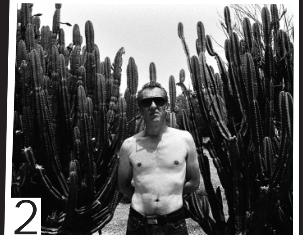
EL MILANO Y LOS BLUYINES EN EL MOURA | SÁBADO 12 | 24 HS.