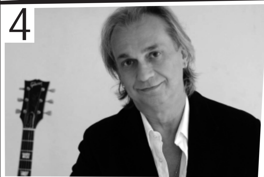
DAVID LEBÓN EN LA TRASTIENDA | VIERNES 25 | 21 HS.