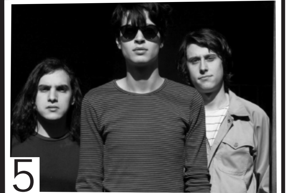
LA CONCHA DE TU MADRE PSYCH FEST EN EL OJO ABIERTO | VIERNES 25 | 23:45 HS.

Si uno piensa en el recorrido de Lebón como músico suenan nombres como Pescado Rabioso, Serú Girán, Pappo Blues, Billy Bond y La Pesada del rock and roll. Y si hablamos de colaboraciones, su relación con el rock nacional es total. Pero lo mejor del guitarrista de la primera oleada del rock argentino es que sigue tocando y grabando. Lebón no es una reliquia que se esconde tras rehabilitaciones o la propia vejez, sino más bien, es un referente de la guitarra y la música urbana en estado de fuego permanente. Por eso es imprescindible no perder oportunidades como la de este mes para verlo en una sala que quizás se esté despidiendo de la ciudad o, en principio, de la marca que la hizo reconocida.