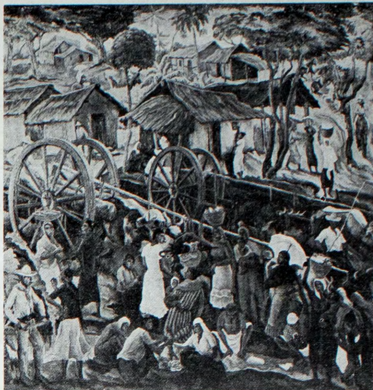
Estampa guaraní -óleo- por Manuel Suero.