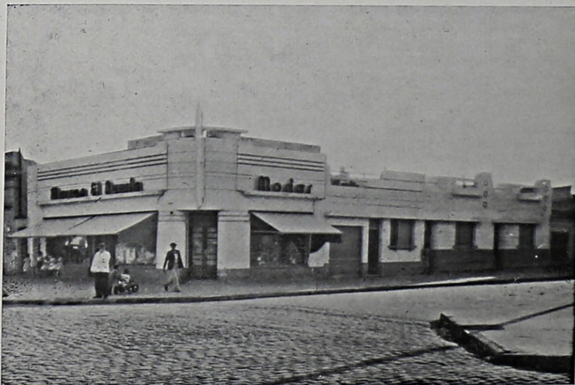
San Martín 3002-04-06 i Amenábar 1009-13-19