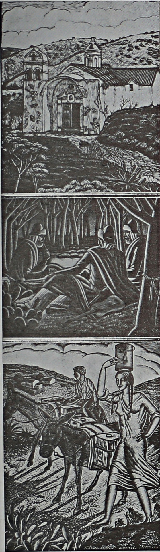
Capilla de Candonga - Noche en el bosque Aguadora

las obtuvo éste que no aquél, a pesar de que "Capilla de Candonga", conquistó el premio "Adquisición" en el 2º Salón Oficial de Córdoba, i que con "Río Primero", otra de sus xilos, hizo suyo el premio "Cámara de Senadores de la Nación" en el 3º.