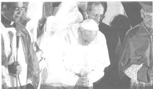
El Papa Francisco se inclina ante el pueblo reunido en la Plaza, al que acaba de pedir «oren para que Dios me bendiga»