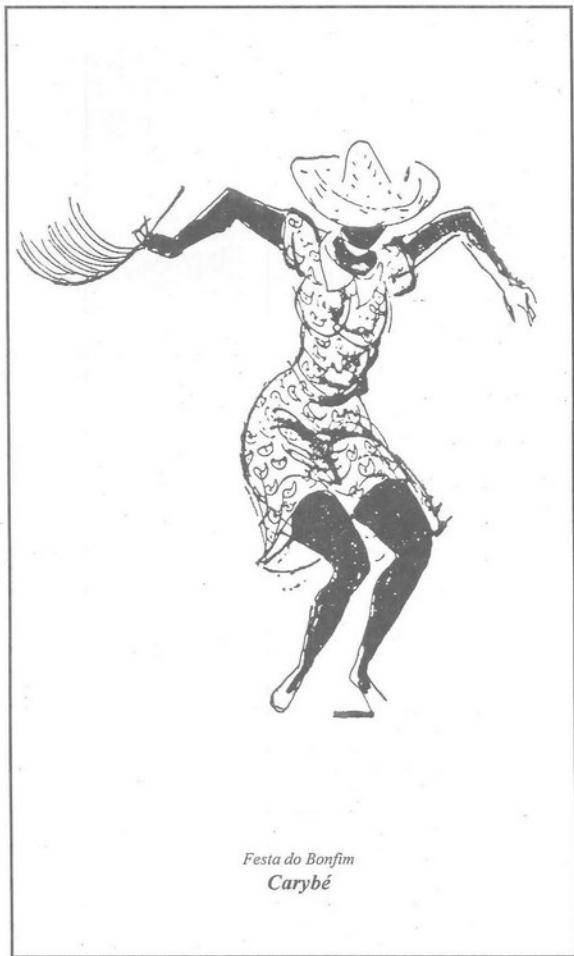
Festa do Bonfim Carybé

Salta - año XXII - N° 218 - Precio $10.-