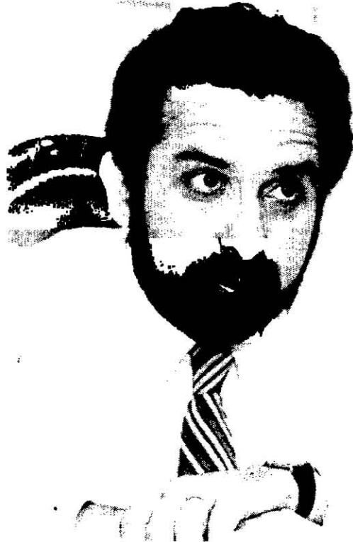
Da Rocha: “El derecho sirve para lograr poder”.