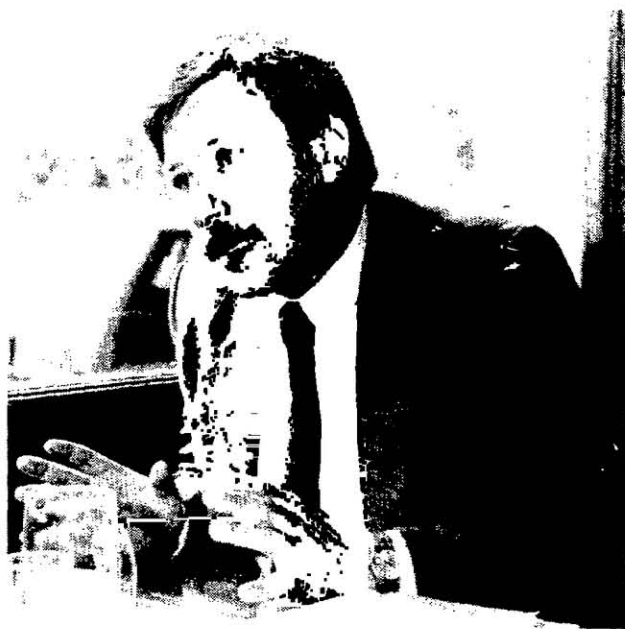
Campolongo: "Fortaleza para revisar todo el pasado".

alejada de toda referencia jurídica. Y, para mí, lo político se inserta en este proceso primero en virtud del fuero que actúa, que es el fuero federal, que siempre tiene una connotación política mucho más acentuada que en otros fueros. Pero, además, te diría que el Estado, la Nación políticamente organizada, no puede nunca basarse en la norma jurídica. No es la norma jurídica lo que lo basa. Es la correlación de fuerzas y los estados espirituales, te diría, lo que se juega. No vamos a caer en el absurdo de la idea positivista de que una norma, por sí misma, va a regir la voluntad de un pueblo. Esta formación política, que te desgrano rápidamente, es la que me lleva a evaluar el juicio como un hito importantísimo, un factor revisionista de nuestra historia. Creo que la vida política argentina no puede empantanarse en el pasado, eso es cierto. Pero tampoco puede tener visiones maniqueas y anuladoras de todo su pasado. Hay que tener la fortaleza para revisar ese pasado, elaborarlo, asumirlo. Estoy convencido de la dialéctica de la historia, sin que esto signifique una conceptualización marxista, sino un concepto filosófico. Creo que esa dialéctica es la que genera la cul-