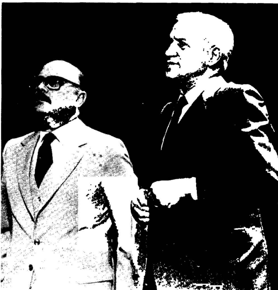
Defensor Battaglia. Acusado Galtieri. ¿Qué se quiere decir cuando no se dice todo?

Federal, pero integrada por otros jueces, la que liberó a los terroristas. Pero aún hay más, y es igualmente revelador.