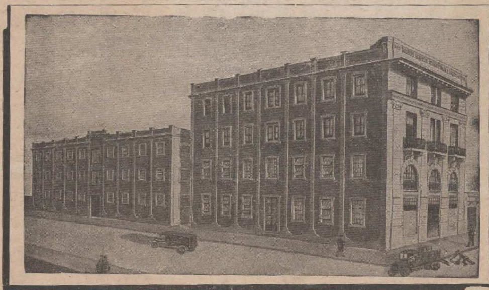
Planta fabril que ocupa una superficie total de 3000 mts. cuadrados.

que cuentan con 43 años de existencia y poseen los más modernos, completos y vastos elementos tipográficos, litográficos y de encuadernación.