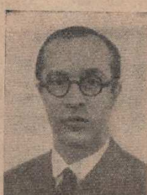
Enrique de Gandía