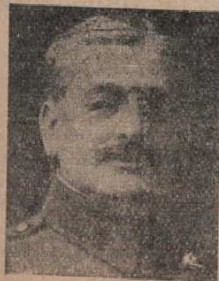
Francisco de Vega

«Que los premios nacionales no deben dividirse, pues son de consagración y no de simple estímulo; que al discernirlos debe tenerse en cuenta no sólo los libros presentados, sino también la obra anterior de los autores; que, tratándose de premios de le-