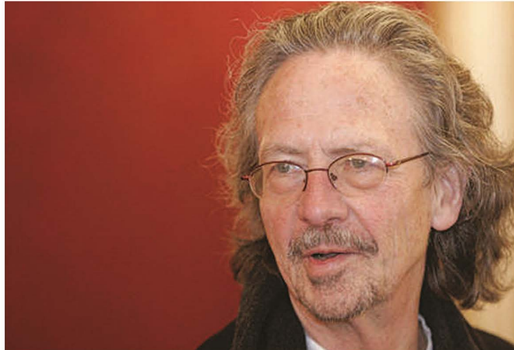
PETER HANDKE. “UN VERDADERO ESCRITOR NO TIENE NADA QUE DECIR. TIENE ALGO QUE ESCRIBIR”.

Es un escritor al que hay que atender. En sus novelas no abundan las tramas, sí las pequeñas historias, o los ritornellos y —desper-