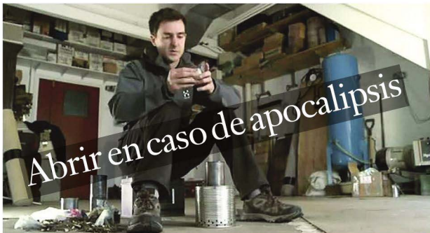
LEWIS DARTNELL. EL BIÓLOGO BRITÁNICO EXPERIMENTÓ EL MISMO TODO LO QUE CUENTA EN SU LIBRO, UNA ESPECIE DE MANUAL PARA LOS QUE LOGREN SOBREVIVIR A UN POSIBLE CATACLISMO.

JUEVES 3 DE MARZO DE 2016 ■ SLT ■ REPORTE NACIONAL ■ 3