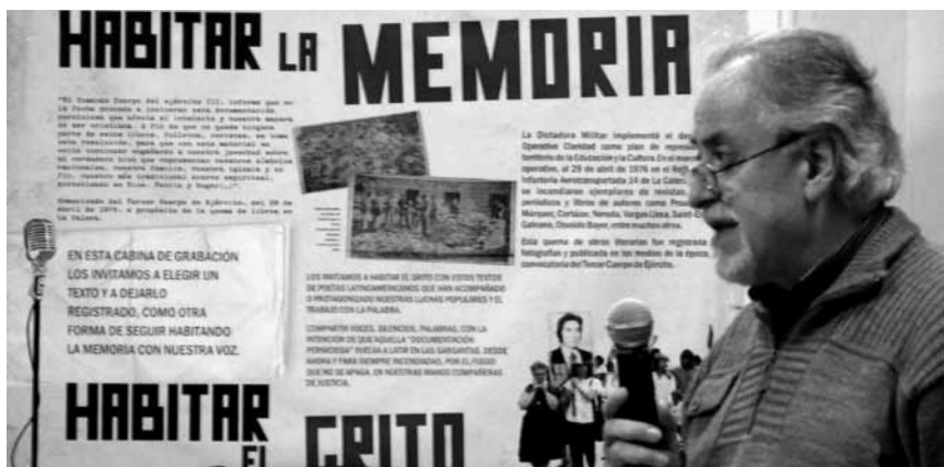
Bocanera en La Perla.