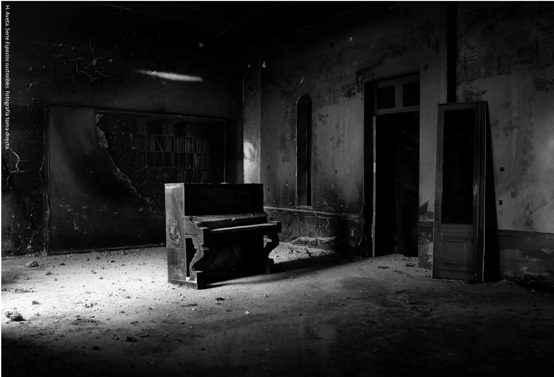
H. Aveta. Serie Espacios sustanciales. Fotografía toma directa.