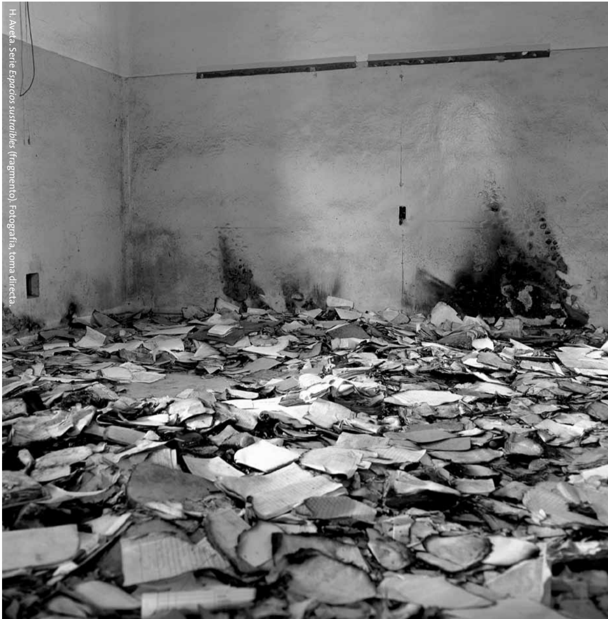
H. Avea. Serie Espacios sustanciales (fragmento). Fotografía, toma directa.