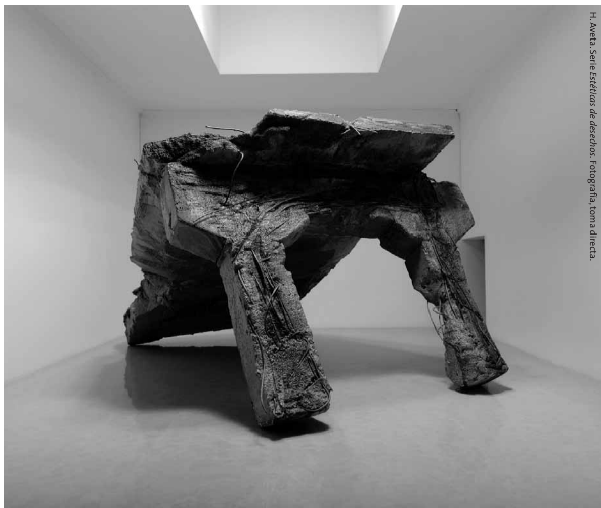
H. Aveta. Serie Estéticas de desechos. Fotografía, toma directa.