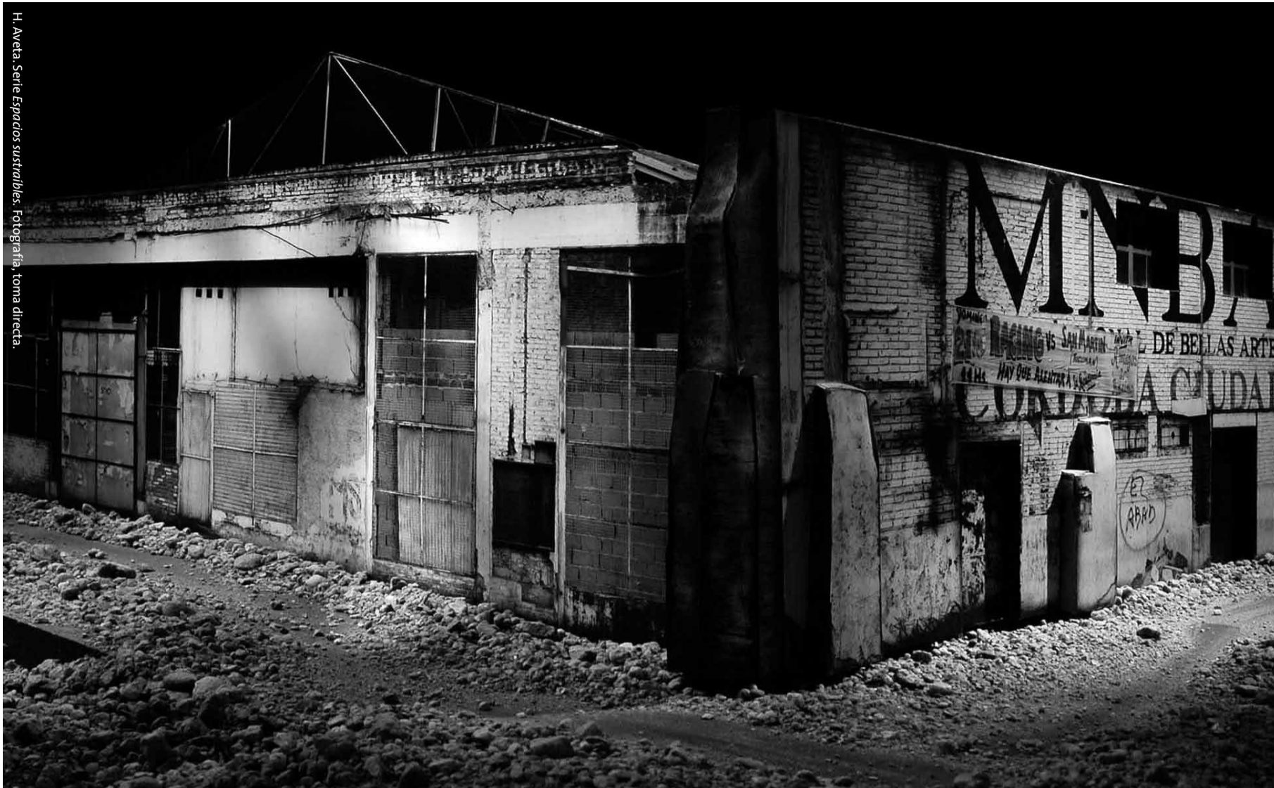
H. Aveta. Serie Espacios sustarables. Fotografía, toma directa.