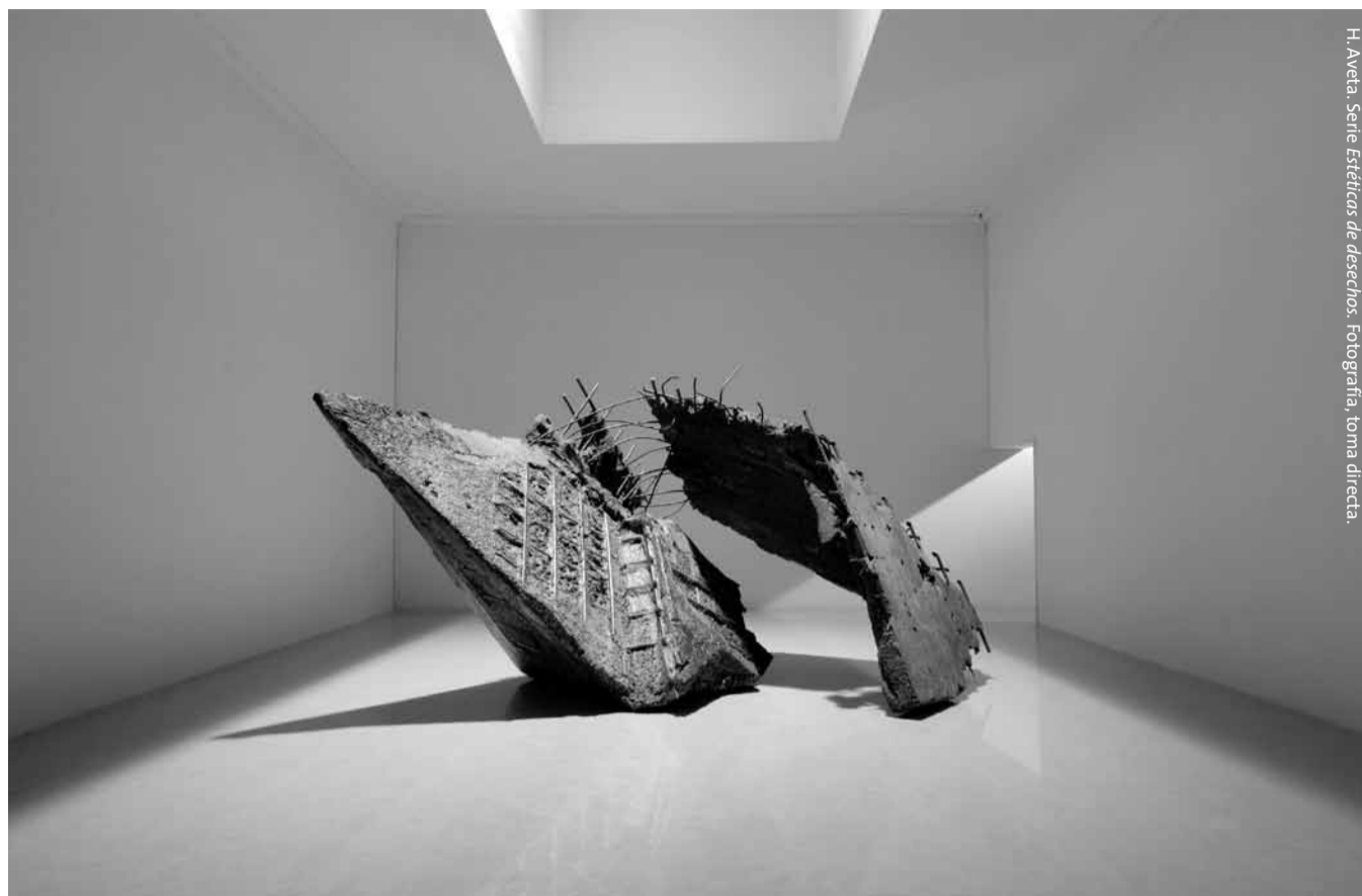
H. Avetia. Serie Estéticas de desechos. Fotografía, toma directa.