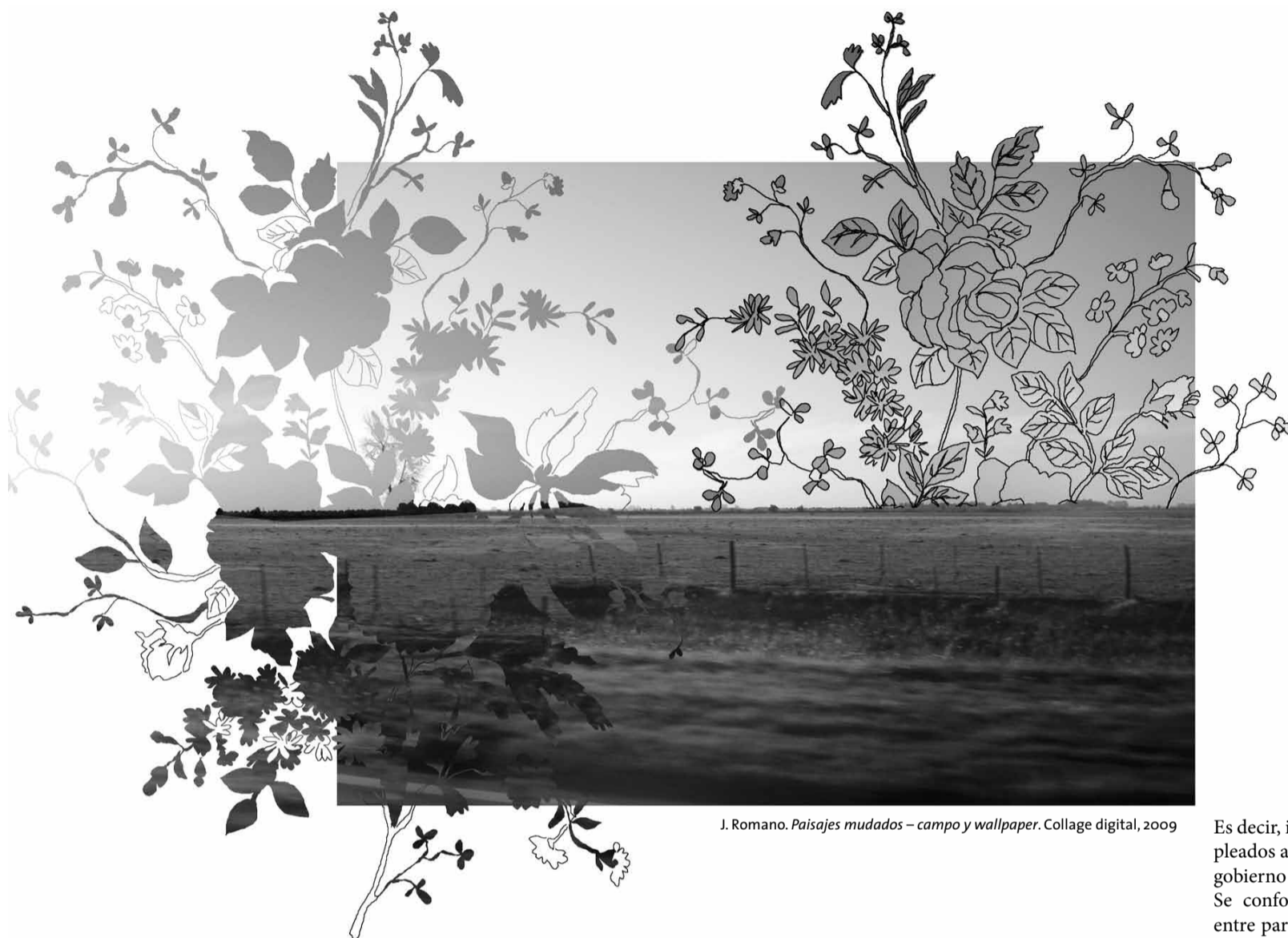
J. Romano. Paisajes mudados - campo y wallpaper. Collage digital, 2009