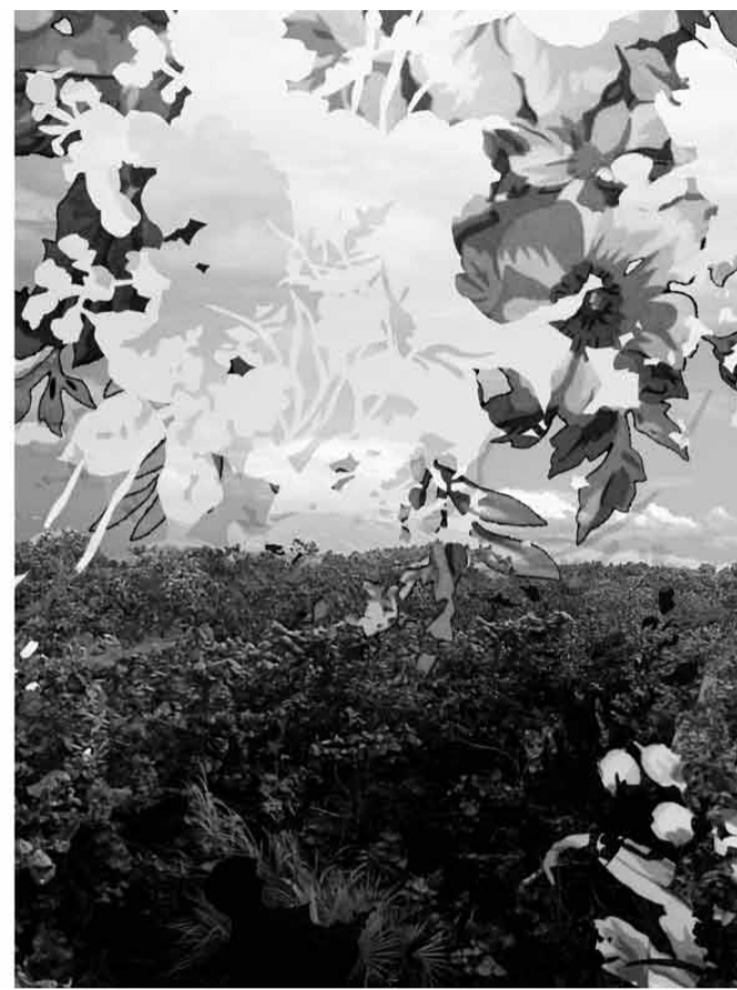
J. Romano. Paisajes contruidos – Guarda (fragmento). Collage digital, 2011

–Incluso va más allá sobre la posible lectura sobre si fue una guerra, que es la lectura que han tenido ustedes. Era gente que había matado y quedaron libres.