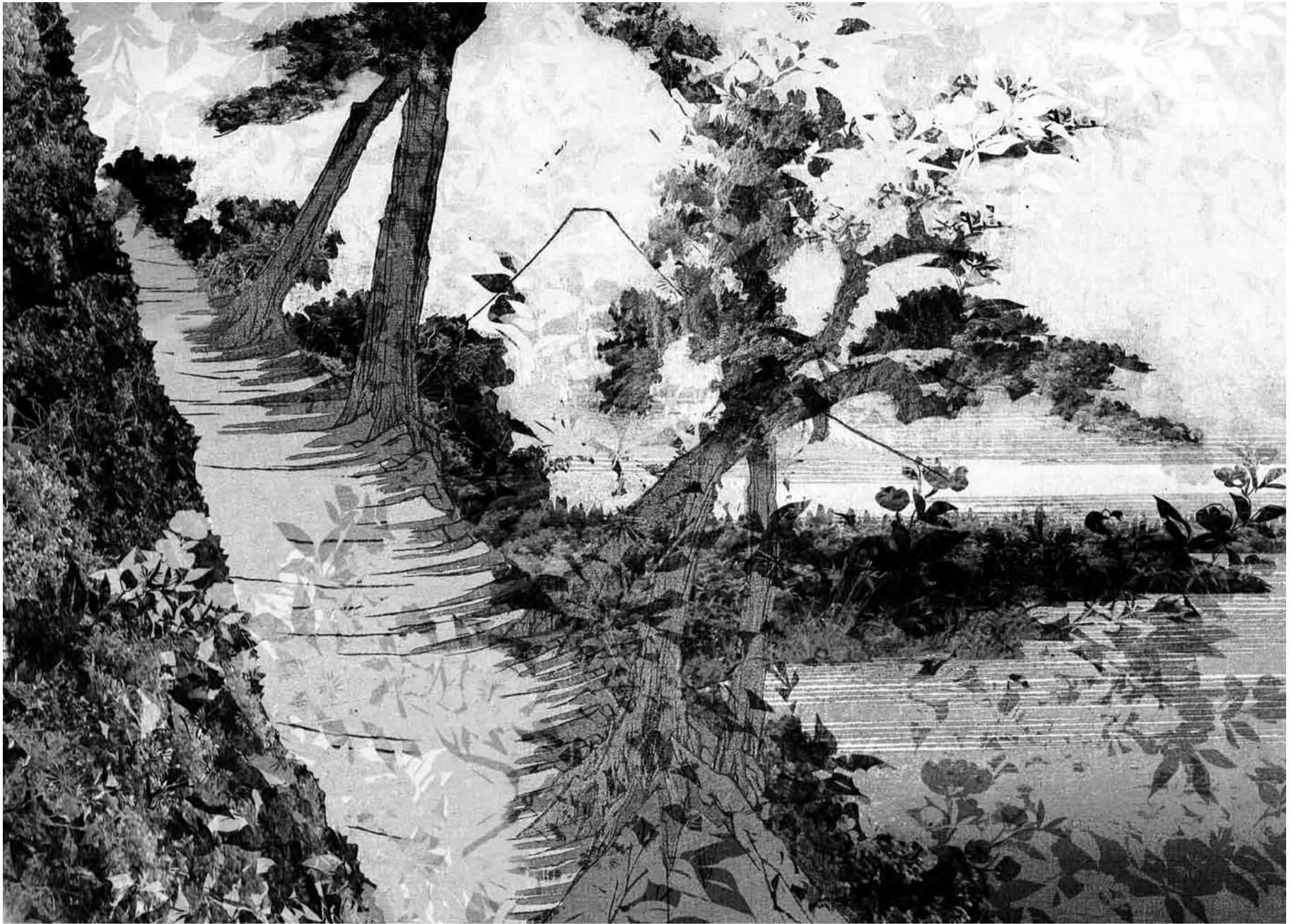
J. Romano. Paisajes prestados – Hiroshige VIII (fragmento). Collage digital, 2011