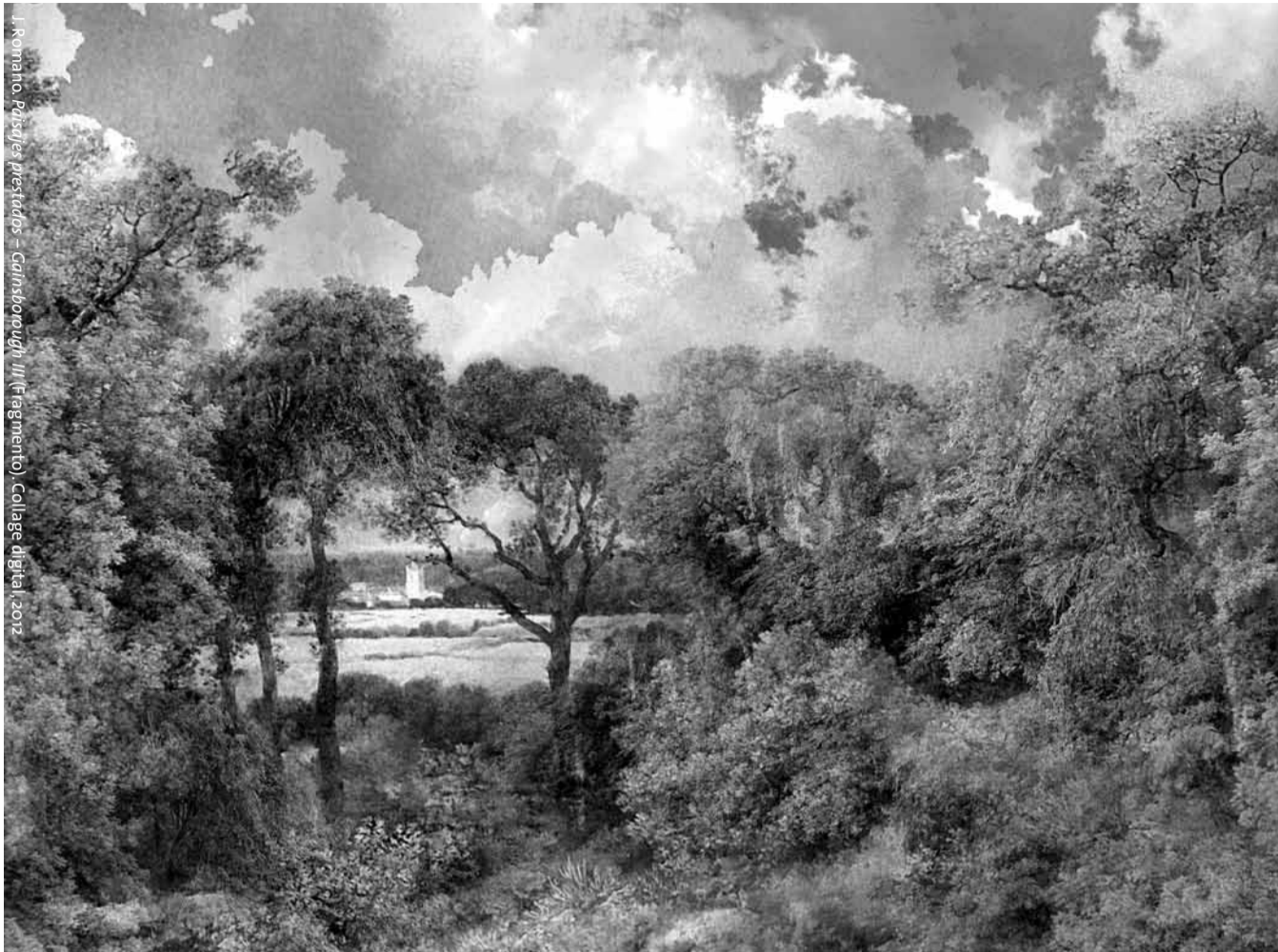
J. Romano, Paisajes prestados - Gainsborough III (Fragmento), Collage digital, 2012