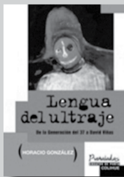
Lengua del ultraje. De la generación del 37 a David Viñas Horacio González Ediciones Colihue, 320 pág. Buenos Aires, 2012

La imaginación, la lucidez y las pasiones juegan su rol en las artes y en las ciencias, pero en variantes distintas. Si existe alguna unidad última entre ellas todavía se nos escapa. Lo cierto es que en estas creaciones los hombres ponen un empeño desmedido. Podemos justificar ese esfuerzo por el placer mismo que provoca esa actividad o, en el caso de la ciencia, por las futuras posibles aplicaciones. Sin embargo ninguna de estas justificaciones alcanza, en el fondo está latente la vieja pregunta religiosa: el afán por perdurar después de la muerte. Aún si no creemos en esto, aún si nos burlamos de la ingenuidad de semejante pretensión, el esfuerzo involucrado y la admiración que provocan esas obras nos recuerdan que una ética sencilla fundada en la pura búsqueda del placer y la comodidad tiene sus limitaciones ■