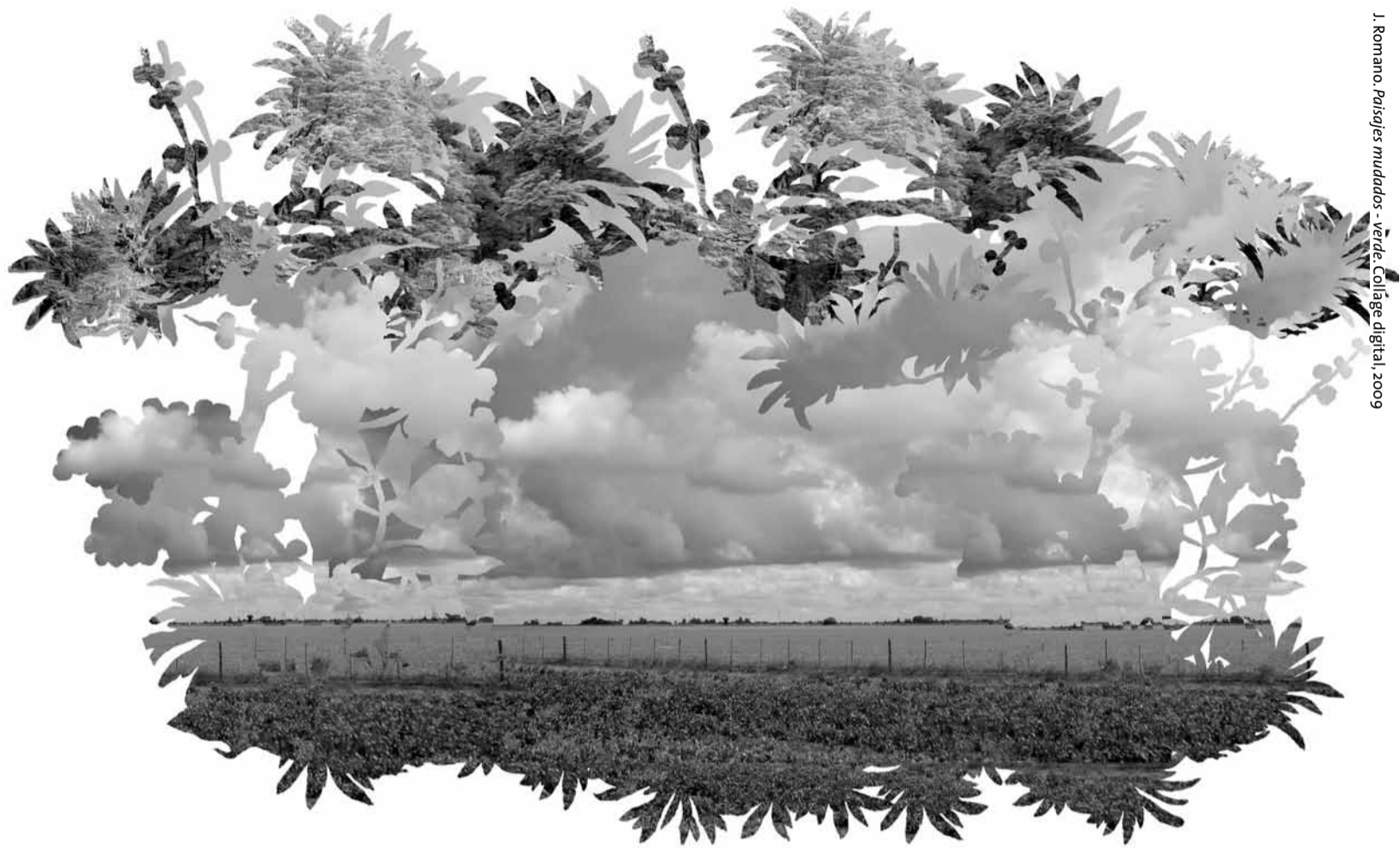
J. Romano. Paisajes mudados - Verde. Collage digital, 2009