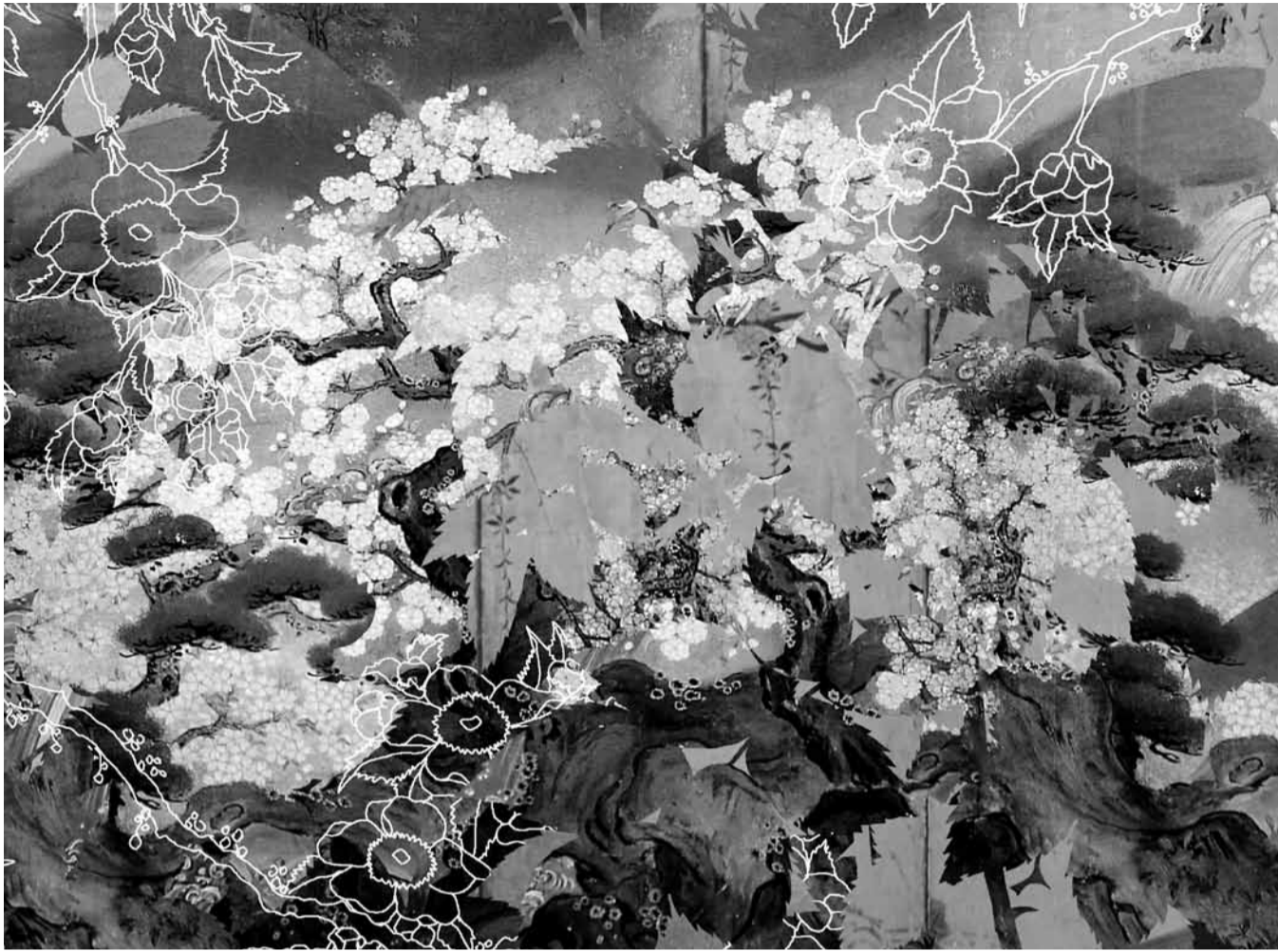
J. Romano. Paisajes dorados IV (detalle). Collage digital, 2010