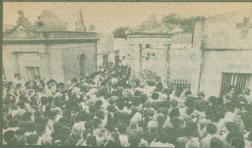
Miles de personas expresan su fe y amor por Pancho Sierra arrojando una flor sobre su tumba