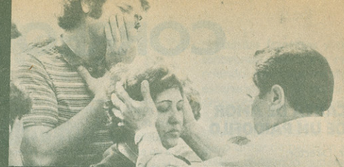
La imposición de manos es la técnica más generalizada entre los curanderos. Los efectos son contundentes.

Del Maestro. Son casi los profesionales del curanderismo. Direccionan la terapia con más intensidad que los demás curanderos y su moral existencial es también más rígida.