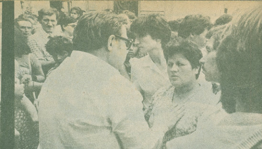
Los espiritistas direccionan mucho más su terapia. No dejan de pasar su aviso doctrinario.

ahora a través de docenas de curanderos que se desparpaman estratégicamente en los alrededores y comienzan a realizar sus manipulaciones.